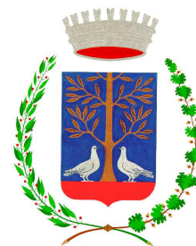
COMUNE DI VIGOLO VATTARO