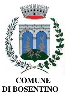
COMUNE DI BOSENTINO